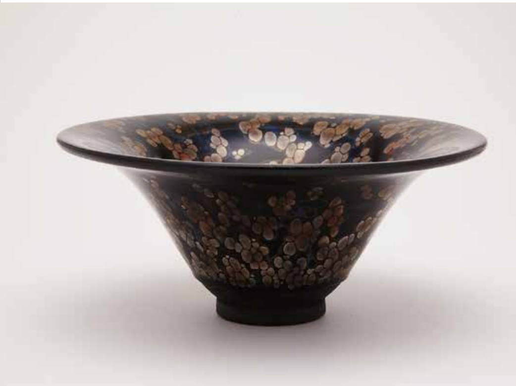
「油滴」 128×128 H48 mm